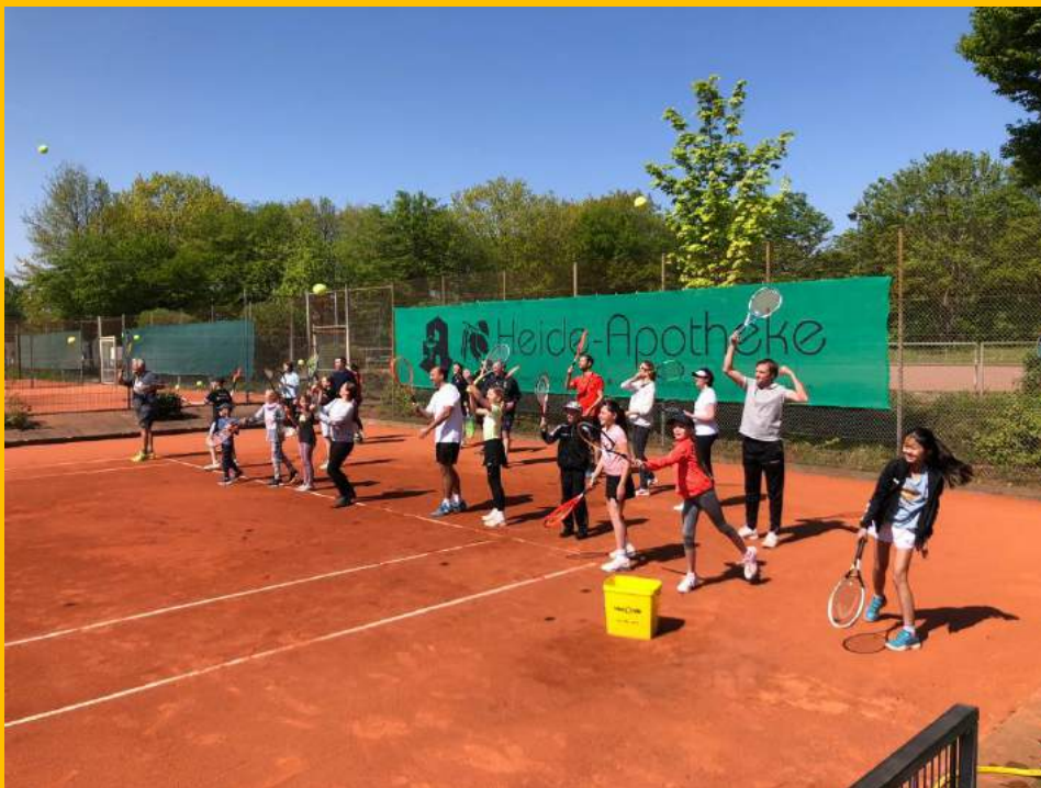
Die Saison wurde von unseren Mitgliedern traditionell von der Grundlinie auf Platz 1 eingeleitet.

War das am 24. April eine schöne Saisonöffnung! Mehr als 100 Gäste bevölkerten die Theodor-Klein-Sportanlage (auch dank freundlicher Werbung des Stadtkuriers) und hatten bei den Show-Matches, beim kostenlosen Schnuppertraining der Tennisschule Richter, beim Bratpfannen-Tennis und beim Tennis-Quiz eine Menge Spaß. Am Ende des Tages konnte die Tennisabteilung erfreulicherweise mehr als zehn neue Mitglieder aufnehmen. Unsere Mitgliederzahl geht damit steil auf die 400 zu.